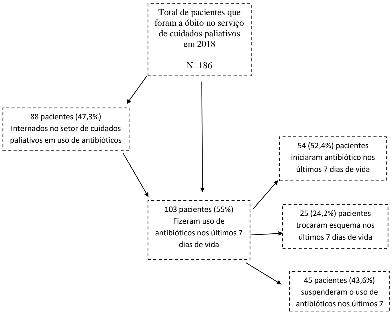
Figura 2- Fluxograma demonstrando o uso de antibióticos pelos pacientes hospitalizados em cuidados paliativos que foram a óbito durante o ano de 2018: uso na admissão e nos últimos 7 dias (uso, início e troca). IMIP, 2018